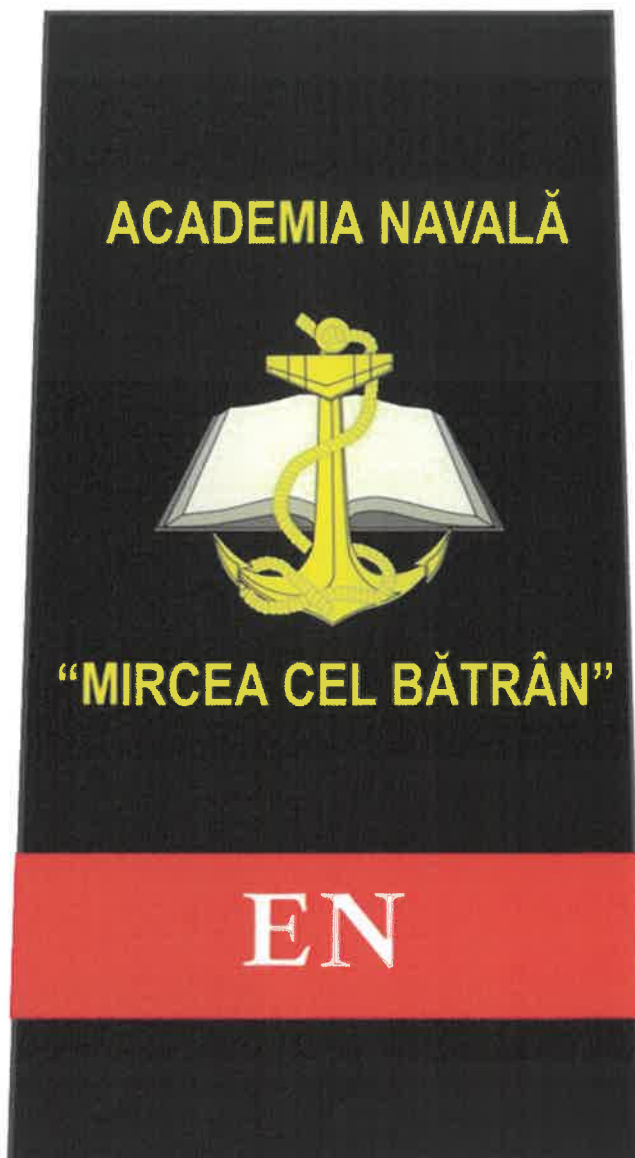
Schiță însemne școlarizare umăr – electromecanică navală