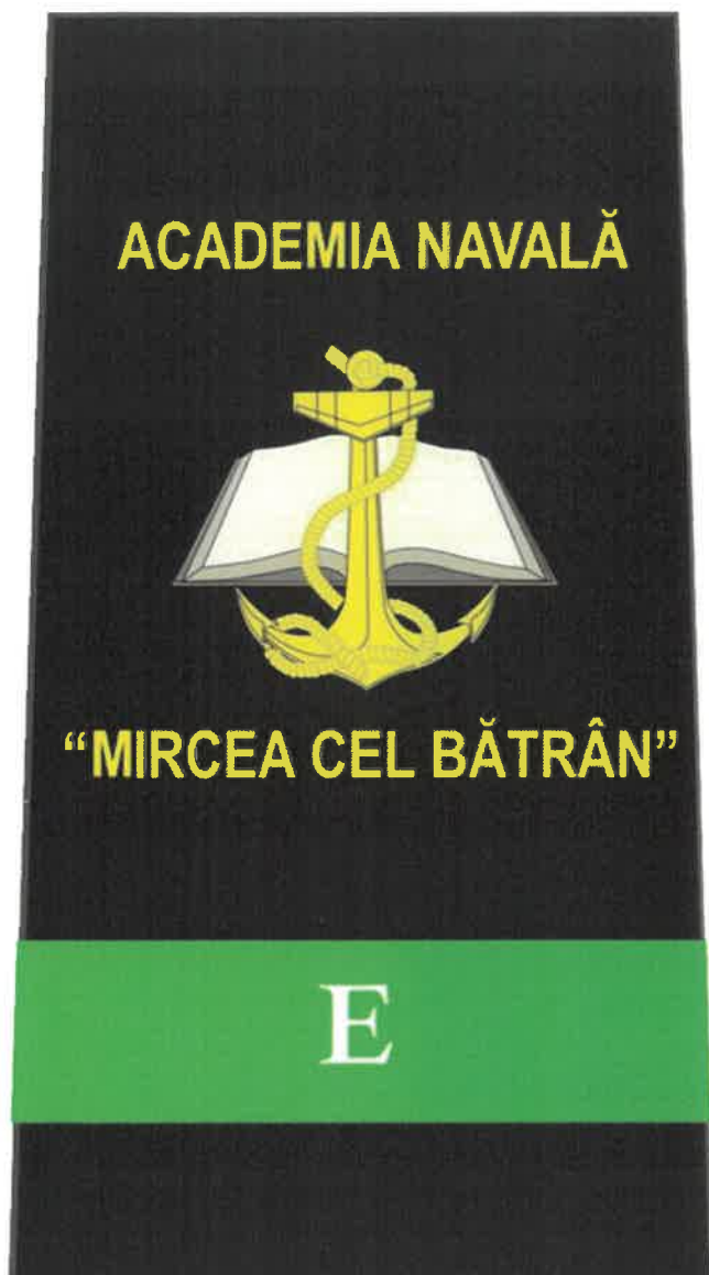
Schiță însemne școlarizare umăr – electromecanică

Însemnele de școlarizare, în funcție de specializarea universitară, se realizează conform modelelor următoare: