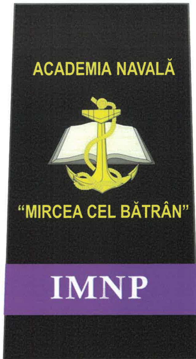
Schiță însemne școlarizare umăr – IMNP

Correspondența culorilor (cod PANTONE) este următoarea: