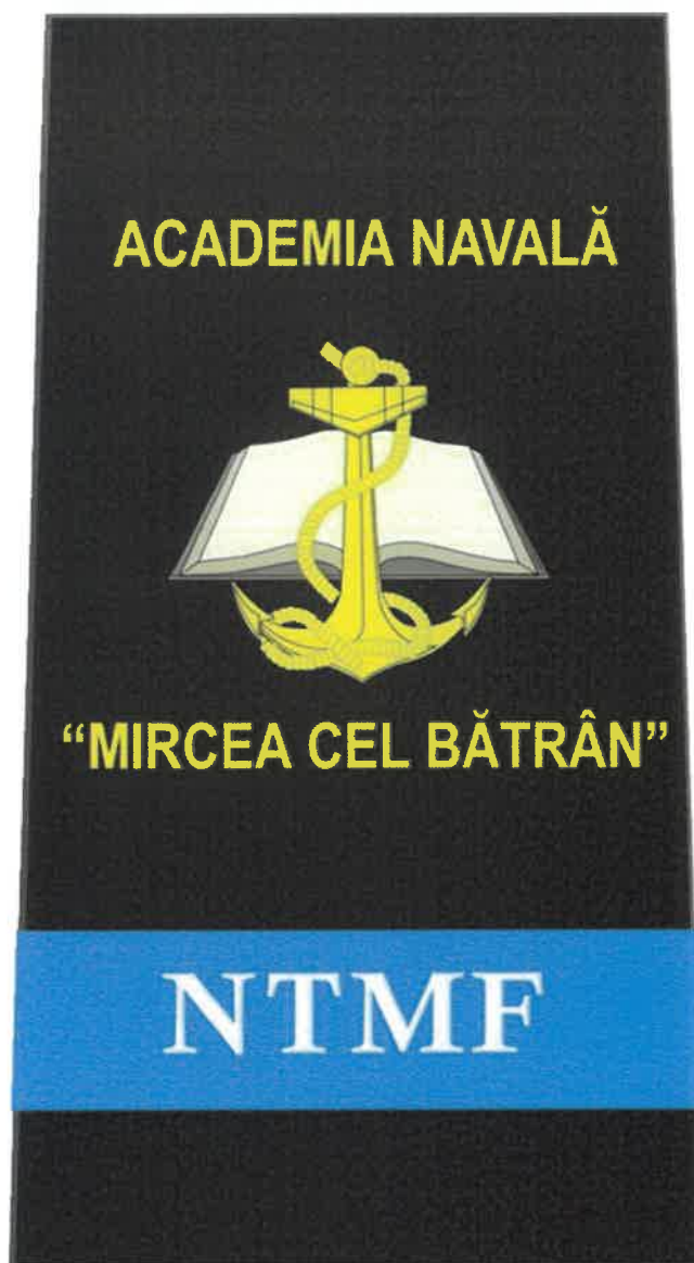
Schiță însemne școlarizare umăr – NTMF